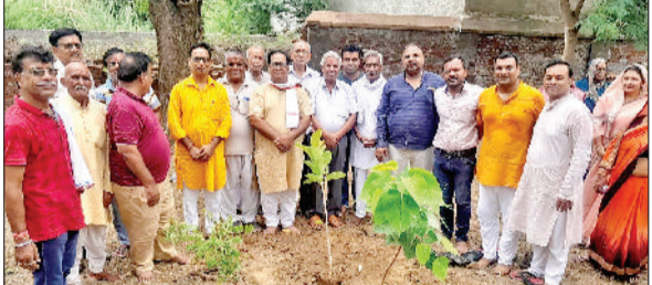
चरखी दादरी। पौधरोपण करते पर्यावरण प्रेमी।