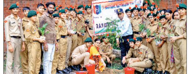
भवानी। पौधरोपण करते एनसीसी कैडेट्स।

हरियाणा बटालियन एनसीसी भिवानी के पेड़ लगाओ जनजीवन को खुशहाल बनाओ अभियान के तहत डीएवी शताब्दी पब्लिक स्कूल कॉन्ट रोड में एनसीसी कैडेट्स ने एक पौधरोपण अभियान का आयोजन किया। कार्यक्रम का मुख्य उद्देश्य पर्यावरण संरक्षण और हरियाली को बढ़ावा देना था।