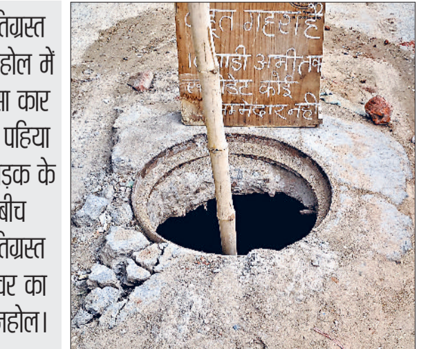
क्षतिग्रस्त मैनहोल में फंसा कार का पहिया व सड़क के बीच क्षतिग्रस्त सीवर का मैनहोल।