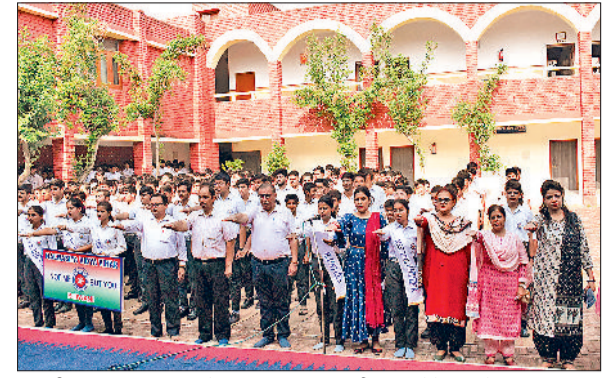
मिवानी। हलासिया स्कूल में तंबाकू मुक्त भारत की शपथ लेते स्वयंसेवक व शिक्षक।