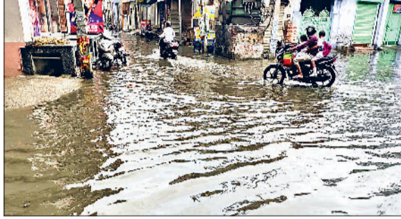
मिवाणी। बारिश के जमा पानी से गुजरते वाहन चालक।

हो गए और कुछ देर बाद तेज हवा का झोंका आया। हवा चलते ही आसमान से हलकी बूंदाबांदी शुरू हो गई। लोगों को लगा कि हलकी बूंदाबांदी कुछ देर बाद बंद हो जाएगी, लेकिन बारिश तेजी पकड़ने लगी। करीब 15 से मिनट तक आसमान से पानी बरसता रहा। शहर के दलान वाले इलाकों में जलभराव की स्थिति बन गई। अनेक जगहों पर आधा तो कहीं पर एक फुट तक बारिश का पानी जमा हो गया। बारिश रुकने के बाद