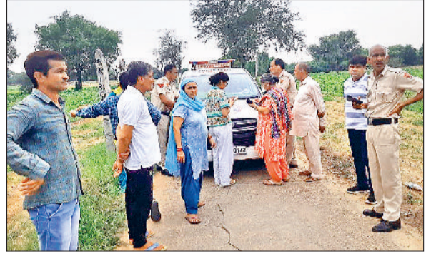
लोहारू। दागी टोडा में स्कूल बस की टक्कर से मासूम घायल होने के बाद मौके पर पहुंची डायल 112 की टीम पूछताछ करते हुए।