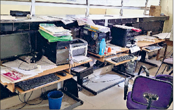
मिवानी। कम्प्यूटर ऑपरेटर के हड़ताल जाने के बाद खाली पड़ी कुर्तियां व खाली पड़े ऑपरेटर के केबिन।

अपनी विभिन्न मांगों को लेकर लंबे समय से संघर्षरत भारतीय मजदूर संघ से संबंधित हरियाणा कंप्यूटर प्रोफेशनल संघ पिछले करीबन एक वर्ष से लगातार सरकार को उनकी मांगों के प्रति चेताने का काम कर रहे हैं। लेकिन सरकार कंप्यूटर प्रोफेशनल की मांगों के प्रति कुंभकर्णीय नींद में सोई हुई है। जिसके चलते कंप्यूटर प्रोफेशनल को मजबूरीवश अनिश्चितकालीन हड़ताल की राह अपनानी पड़ी। जिसके चलते बुधवार को तीसरे दिन भी कंप्यूटर प्रोफेशनल की हड़ताल जारी रही। दूसरी तरफ कम्प्यूटर ऑपरेटर्स की हड़ताल के चलते बुधवार को भी तहसील व