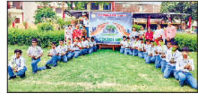
मिवानी। वन महोत्सव के दौरान विद्यार्थियों में पौधे वितरित करते हुए।