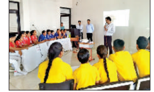
मिलकपुर के आनंद स्कूल में विज्ञान प्रतियोगिता में उपस्थित विद्यार्थी।

मिलकपुर के आनंद स्कूल फॉर एक्सलेंस में इंटर हाउस विज्ञान एवं सामाजिक विज्ञान प्रतियोगिता करवाई गई। जिसमें स्कूल के चारों सदरन- सरोजिनी नायडू हाउस, ध्यानचंद हाउस, अब्दुल कलाम हाउस व मदर टेरेसा हाउस ने भाग लिया। इस प्रतियोगिता में मुख्य चार राउंड बनाए गए। पहला राउंड- विषय विशेष राउंड, दूसरा विज्ञान राउंड, तीसरा रैपिड राउंड तो अंतिम बजर राउंड रहा। सभी बच्चों ने इस