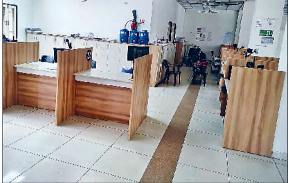
मिवानी। कम्प्यूटर ऑपरेटर के हड़ताल जाने के बाद खाली पड़ी कुर्तियां व खाली पड़े ऑपरेटर के केबिन।

उपायुक्त कार्यालय स्थित ई दिशा केंद्र में कोई भी कार्य नहीं हुआ। ऑपरेटर्स की हड़ताल के चलते लोगों को बिना कार्य करवाए ही वापस लौटना पड़ा। यह स्थिति मिवानी के अलावा तोशाम, बवानी, खेड़ा व लोहारू में भी बनी रही। पूरे दिन विभिन्न कार्य के लिए आए लोगों को वापस लौटना पड़ा। गौरतलब है कि कंप्यूटर प्रोफेशनल के हड़ताल पर जाने से ड्राइविंग लाइसेंस, गाडियों के पंजीकरण व नवीनीकरण एवं ट्रांसपर, जमीन की रजिस्ट्रियां व इंतकाल सहित विभिन्न प्रकार की